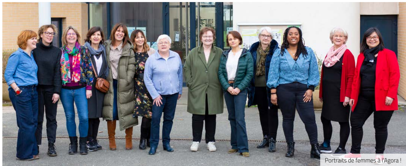
Portraits de femmes à l'Agora !

À l'occasion de la Journée internationale des Droits des Femmes, l'Agora met à l'honneur ses bénévoles et professionnelles dans le cadre d'une exposition photo 100 % féminine. Tour d'horizon.