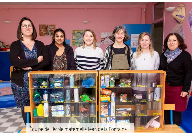
Équipe de l'école maternelle Jean de la Fontaine

Engagée aux côtés de SQY, la Ville soutient les bonnes initiatives portées par les acteurs du territoire : habitants, écoles, associations, entreprises... Découvrez deux exemples de projets élancourtois durables et vertueux.