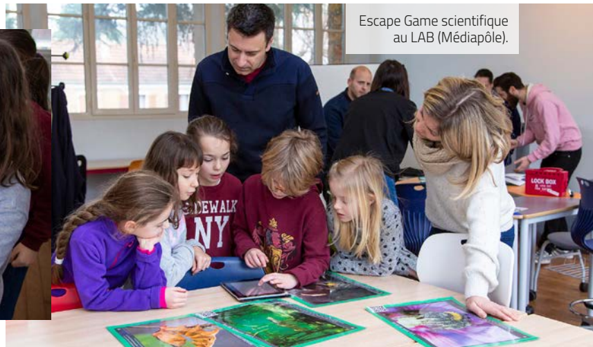
Escape Game scientifique au LAB (Médiapôle).