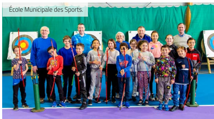
École Municipale des Sports.