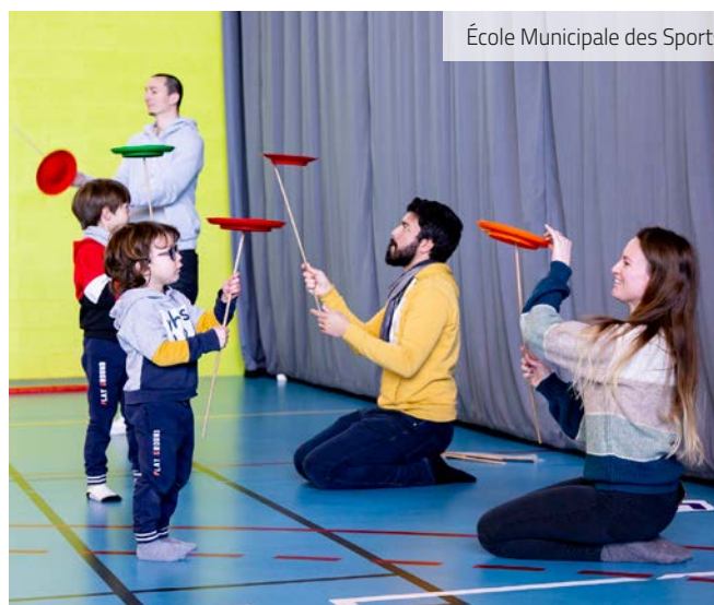
École Municipale des Sports.

Samedi 11 février, les parents des enfants de l'École Municipale des Sports étaient invités à participer à la dernière séance avant les vacances. Nos funambules, jongleurs et acrobates, âgés de 3 à 6 ans, ont ainsi pu faire une démonstration de leurs talents d'artistes de cirque !