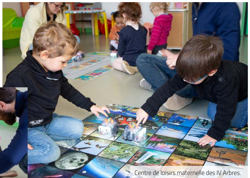
Centre de loisirs maternelle des IV Arbres.