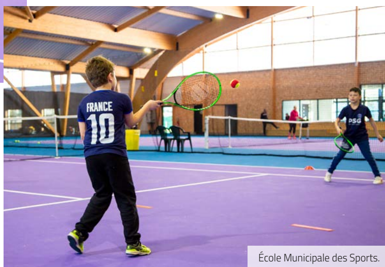
École Municipale des Sports.