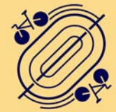
CYCLISME SUR PISTE PARIS 2024